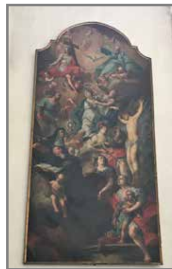
„Bild von den 7 Zufluchten“ Das Bild befindet sich in Augsburg in der Kirche der seligen Gisela