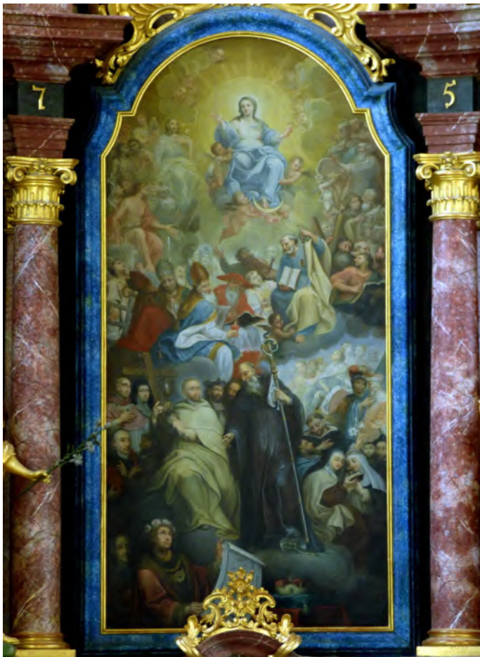
Allerheiligen-Altar in Neuberg an der Mürz

Die Pfarrmesse am Sonntag (8.11.) begehen wir im (Rück-) Blick auf den Weltmissions-Sonntag als 3. Welt-Messe . Das heurige Beispielland ist Uganda. Die Messe um 10 Uhr wird von der 3.-Welt-Gruppe und dem Ensemble Klangmosaik gestaltet.