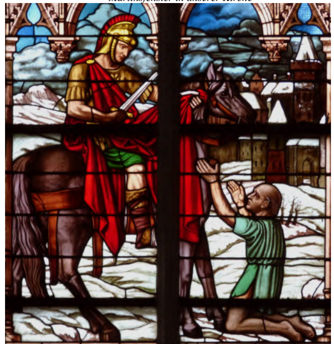
Martinsfenster in unserer Kirche

Am Sonntag (15.11.) feiern wir das Hochfest des Hl. Markgrafen Leopold ,